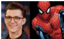
Tom Holland ist Spiderman