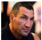
Dr. Wladimir Klitschko